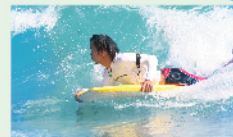
趴板衝浪體驗$200 長板衝浪體驗$300 一人一次/50min