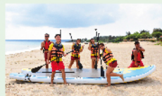
龍舟板體驗 $200/一人一次 50min/8人(4人成行)