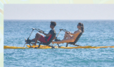
海上器材出租服務 $300/一人/60min