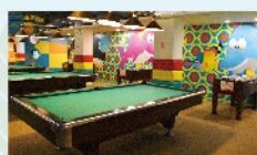
撞球、桌球、手足球 免費/30min/次