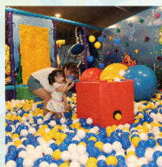
夏都星樂園 房客免費