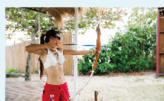
狩獵弓射擊體驗 免費/次 40min/40人