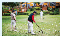
木球 免費/次 60min/4組