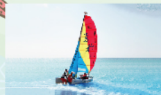
霍比式帆船體驗 $300/一人一次 30min/4人