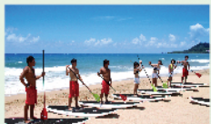
SUP 站立式划槳體驗 $300/一人一次 50min