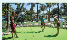
果嶺推桿練習場 免費/一人一次 60min/6人