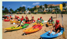
海洋獨木舟體驗 $200/一人一次 50min